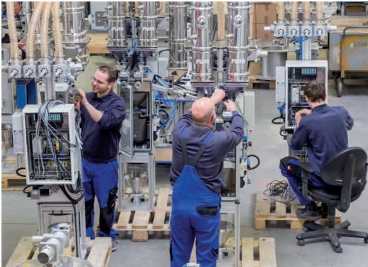
Сборочный цех фирмы FDM в Тройсдорфе. Здесь собирают и испытывают дозаторы для разных сфер производства (трубы, упаковочные пленки, листы, медицинская продукция и т. д.) перед отправкой клиентам

тенциях и всесторонней поддержке клиентов, в том числе и на местах. Клиенты группы Pivovap могут доверять структуре, насчитывающей семь производственных площадок и 24 подразделения по всему миру.